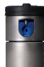
I-20 s modrou štandardnou tryskou

Čierne s krátkym dostrekom (obj. č. 466100)